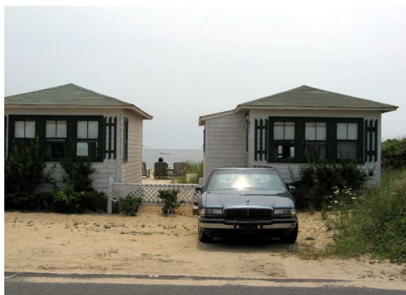
Vers Provincetown (Mass.)

Nous avons passé cinq (5) nuits dans ce camping.