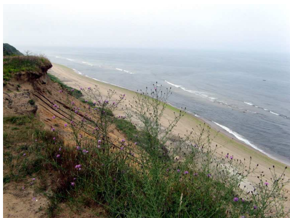
North Truro (Mass.)

Nous avons 12 km à faire pour nous rendre à Provincetown et le trajet à vélo était très agréable, sur une petite route longeant la mer et les petits chalets typiques de la région.