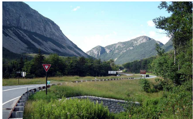
White Mountains (New Hampshire)