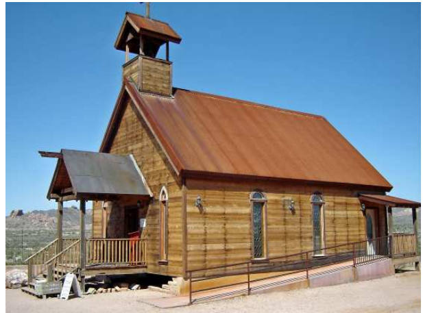
tout à côté de la petite église