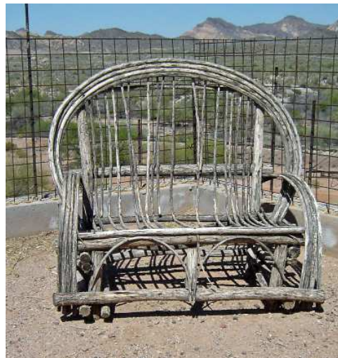
Il vente fort dans le coin...même les fauteuils ont perdu des plumes