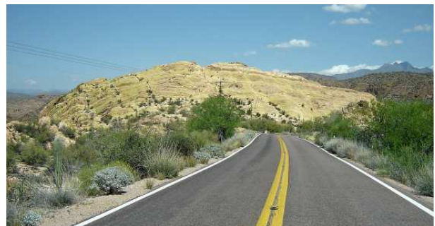
Nous poursuivons notre route...