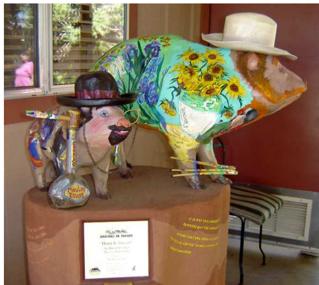
« Javelinas on parade »