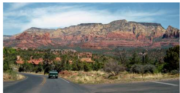
La route de l'aéroport