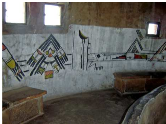
L'extérieur et l'intérieur du Desert View...