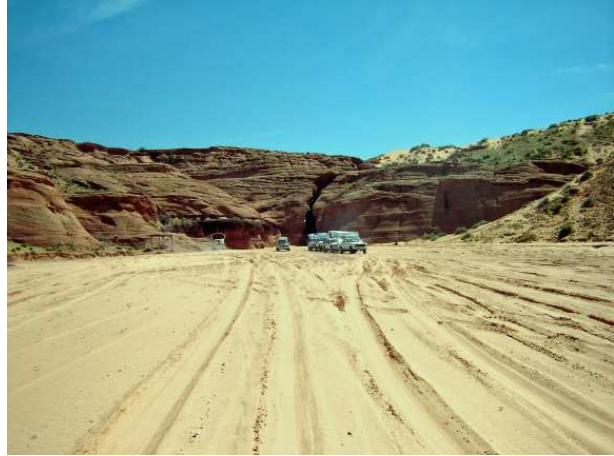
Vers Upper Antelope Canyon