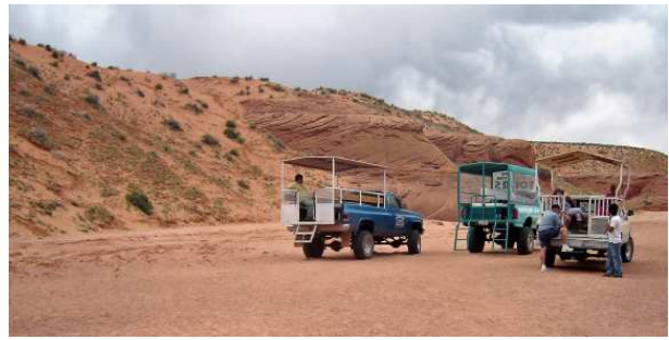
L'entrée du canyon