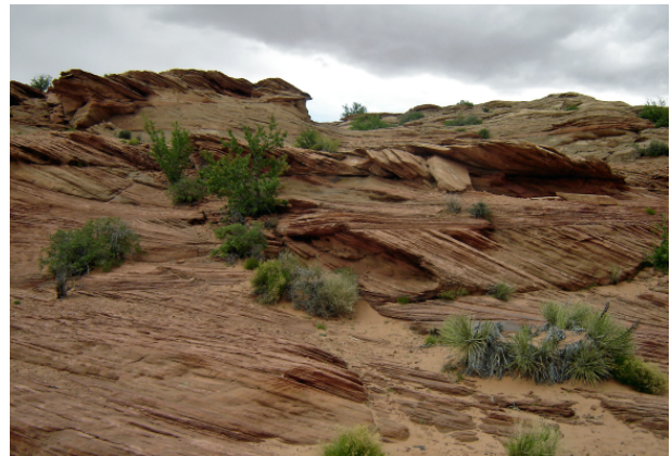
La rivière Colorado, la Glen Canyon Dam et les rochers autour