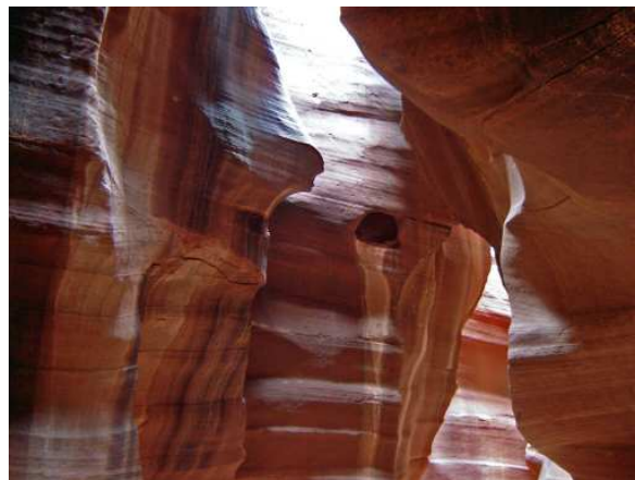
Et des images de l'intérieur