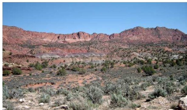
Vermillion Cliffs National Monument, vu de House Rock Valley Road...