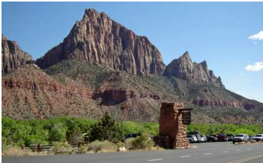
Route 9, vers St.George

Domage mais dans ma malchance, je me considère TRÈS chanceuse.