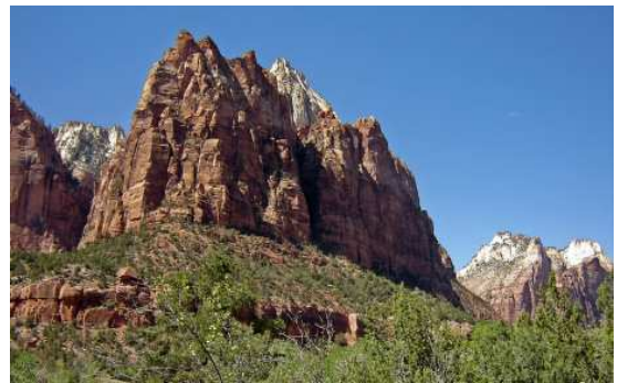
Court of the Patriarchs