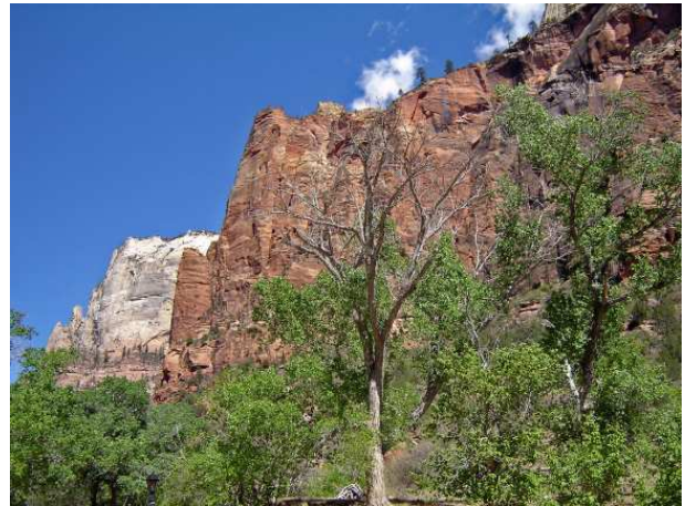
Vue de Zion Lodge