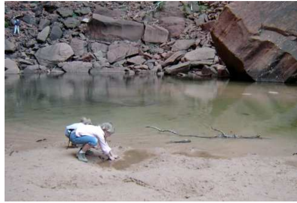
Middle Emerald Pool