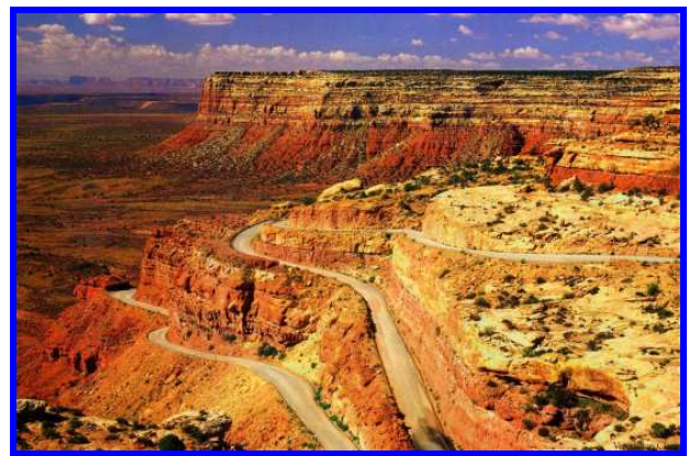
Zion, Vermillion Cliffs