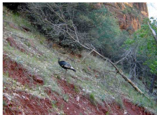
Une dinde sauvage