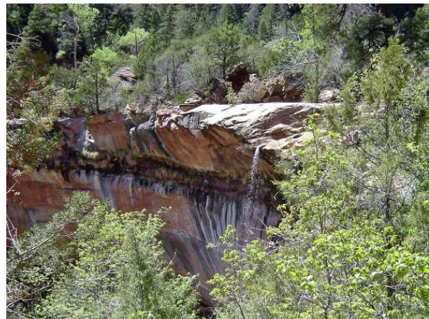
Chute qui entretient Lower Emerald Pool