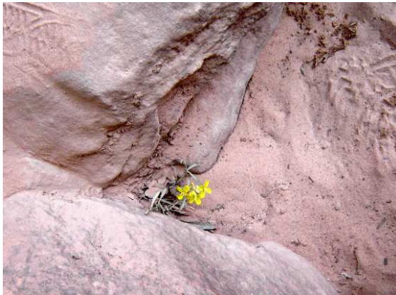
Une « survivor »