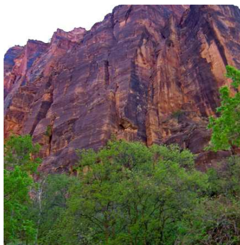
Au bout de la route, premier sentier, Temple of Sinawava, Riverside Walk, le long de la Virgin River