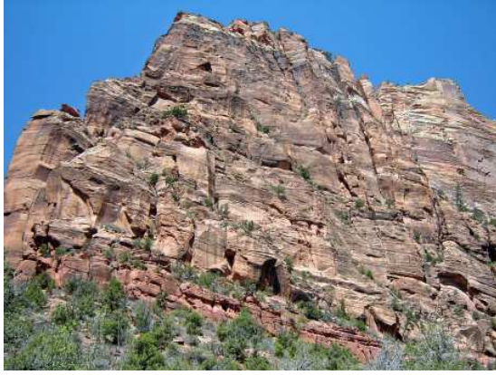
Vue le long du sentier