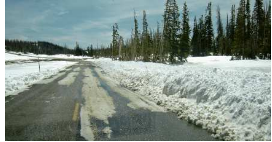
De Parowan à Brian Head sur la route 143