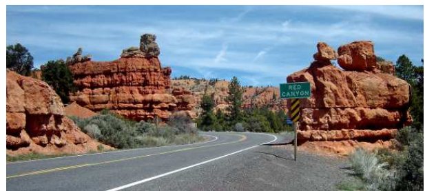
Route panoramique 12, Red Canyon

Red Canyon ( http://www.americansouthwest.net/utah/red_canyon/index.html )