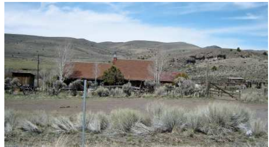
Lac Panguitch (de Brian Head à Panguitch)