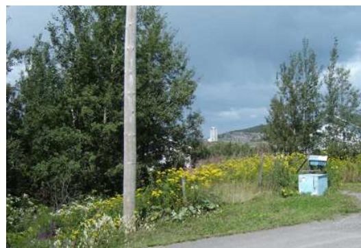
et le port