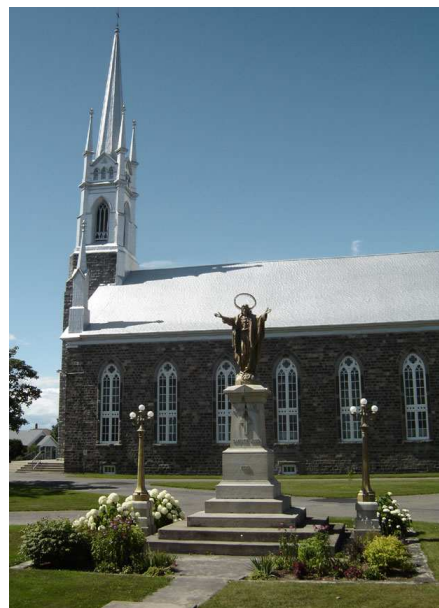
L'église du village