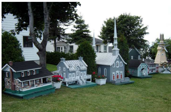
Musée de miniatures

Après Notre-Dame-du-Portage, je suis allée vers Cacouna et L'Isle-Verte.