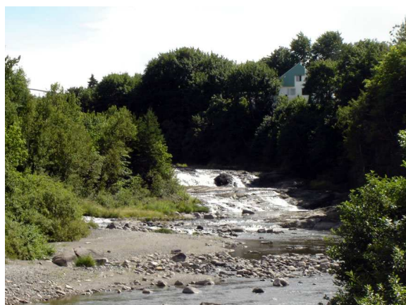
La Rivière Verte