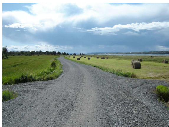
Le chemin de la Rivière-aux-Vases