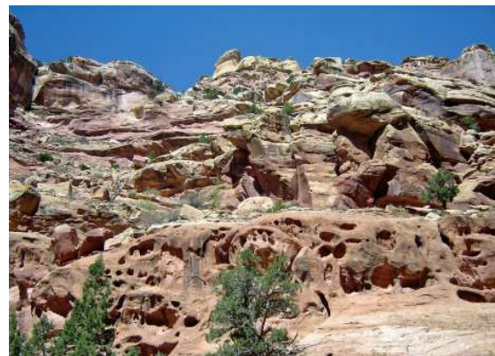
Photos prises sur la route, avant de m'engager sur le sentier