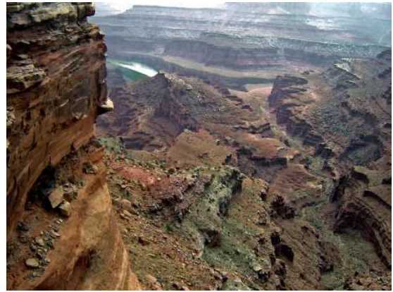
Dead Horse Point Overlook

...Dead Horse Point est situé sur un haut plateau, à une élévation de 6 000 pieds au-dessus du niveau de la mer. De la pointe, on peut apercevoir différentes strates de périodes géologiques qui révèlent 300 millions d'années de l'histoire géologique de la terre. » (Traduit de la brochure du parc)