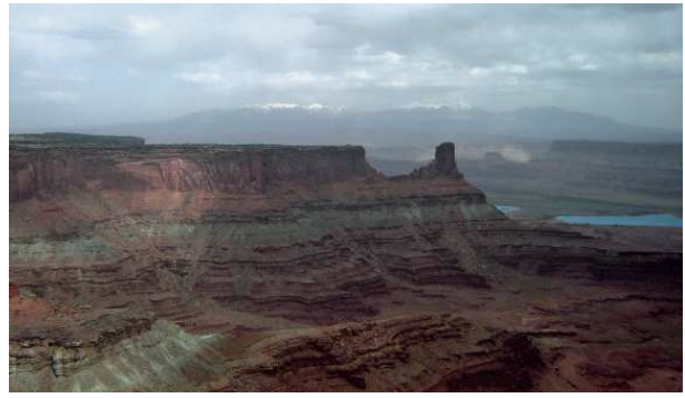
Dead Horse Point State Park, près du Centre d'information