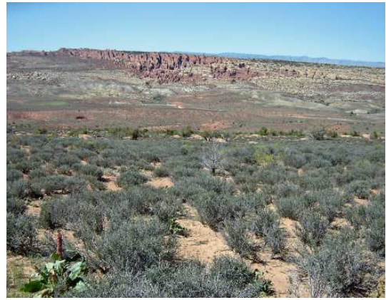
Cache Valley Overlook