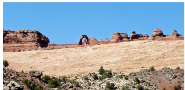
Delicate Arch et autour