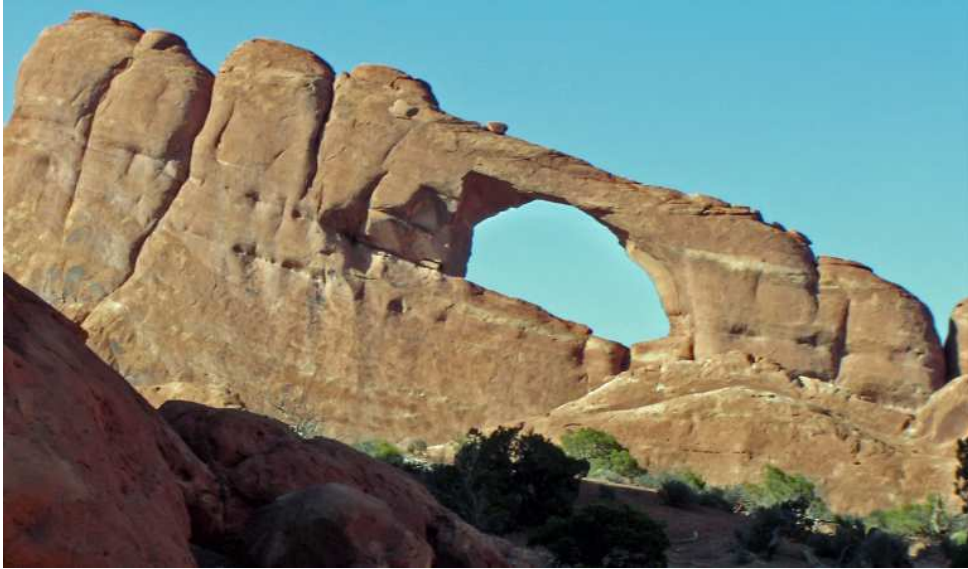
Skyline Arch et autour