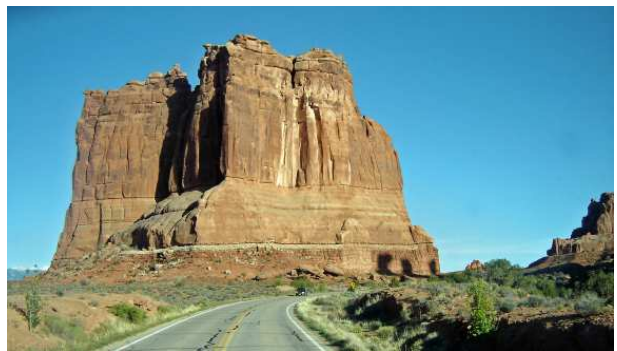
Le chemin du retour