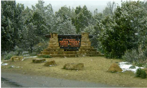
L'entrée de Mesa Verde sous la neige...

Comme je patauge dans la boue et que les toilettes et douches (non chauffées...brrrrr !) sont minimalistes, mon honneur a un peu de difficulté avec les 26$ demandés. Je laisse tout de même 20$ puisque c'est ce que j'ai payé hier pour beaucoup mieux que ça.