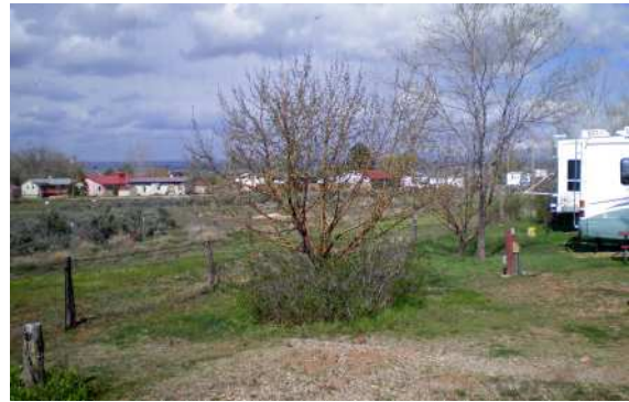
Vue du terrain de camping à Cortez, le lendemain matin