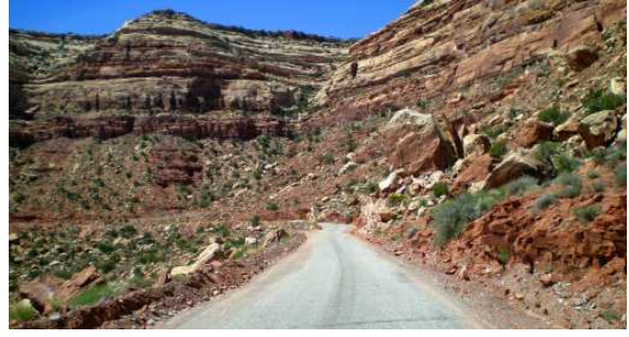
Vers Mokee Dugway