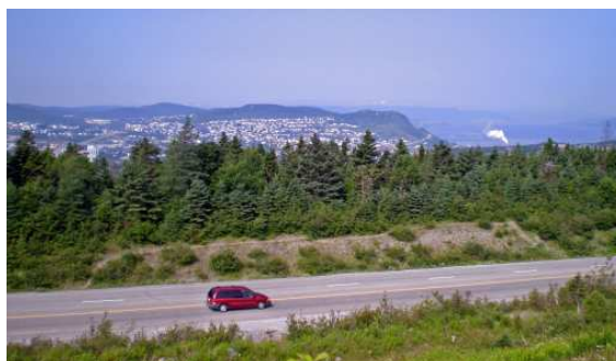
Vue du Zellers