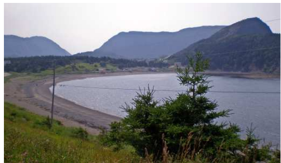
Vers et Bottle Cove

Je m'arrête ensuite au Blow Me Down Provincial Park (voir lien plus haut). C'est tellement beau ici que j'ai le goût d'y rester quelque temps. Surtout qu'il y a des sentiers de randonnée à parcourir.