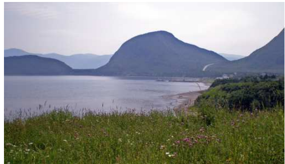
Vers Lark Harbour