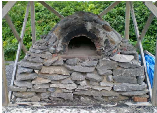
Four à pain