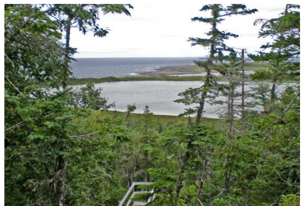
Sentier vers Phillip's Garden et Crow Head, sites paléo-esquimaux (Dorset)