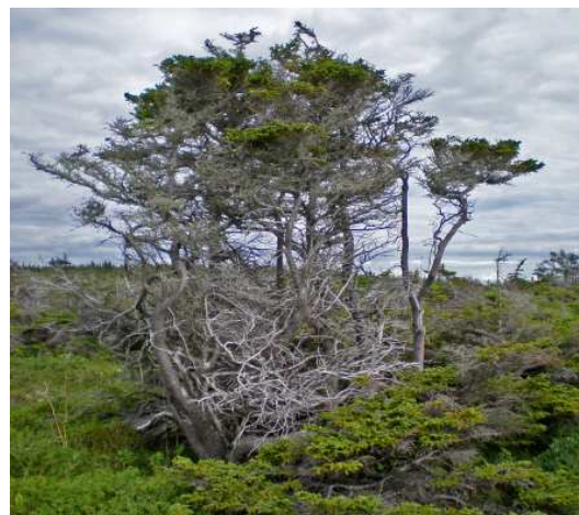
Les sites de Philip's Garden et Crow Head

...De l'an 2000 av. J.-C. à l'an 1000 de notre ère, l'est de l'Arctique canadien était occupé par un peuple que les archéologues ont baptisé « Paléo-Esquimaux », et dont on trouve dans l'île de Terre-Neuve les sites d'occupation les plus méridionaux. Deux grands villages habités à longueur d'année ont été explorés à Phillip's Garden, l'un