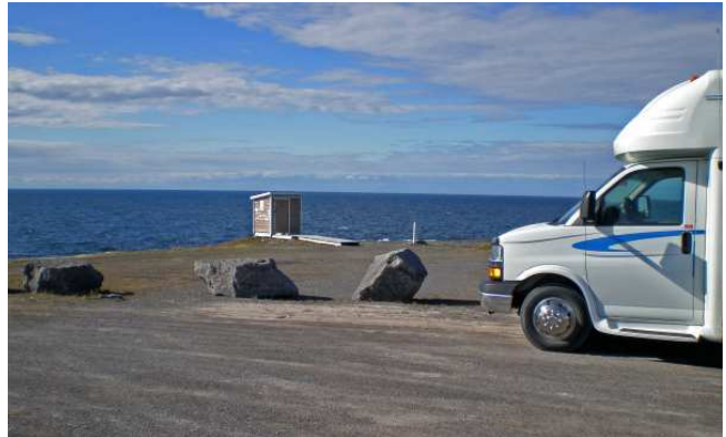
Point Riche, Port au Choix