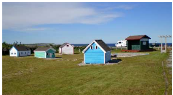
Black Duck Cove, Seashore Day Park