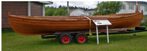
Chaloupe basque (baleinière)