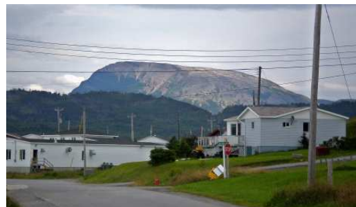
Port au Choix, le village