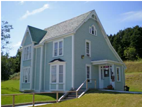
Le bureau de poste