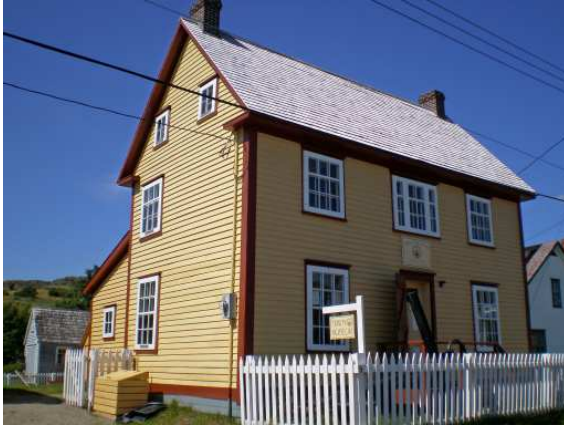
Le musée de Trinity