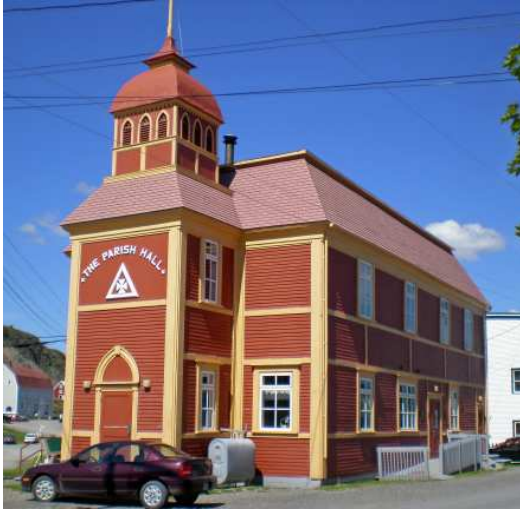
La salle paroissiale