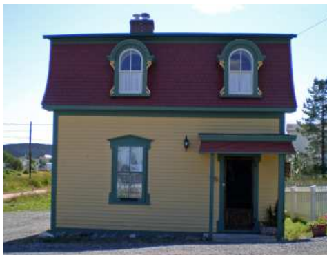
Une jolie petite maison