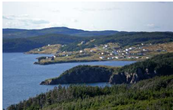
Trinity East, sentier Skerwink