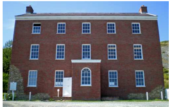
Lester-Garland House (une des plus grosses résidences en Amérique du Nord britannique)