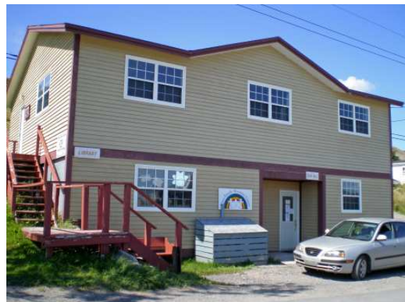
La bibliothèque municipale