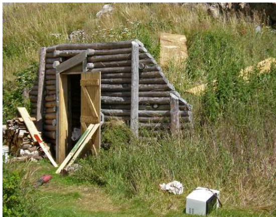
Un caveau à légumes (root cellar)