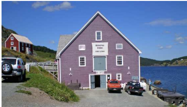
Rising Tide Theatre

On y retrouve effectivement plusieurs bâtisses bien préservées et bien entretenues. Chacune a son histoire et c'est sûrement plus intéressant pour les gens de Terre-Neuve que pour moi, alors je me contente de les regarder de l'extérieur d'autant plus qu'il faut payer à chaque endroit et que je garde un souvenir mitigé de Mockbeggar Plantation, à Bonavista.