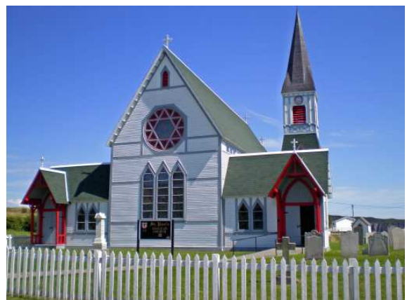
Une charmante petite église en bois