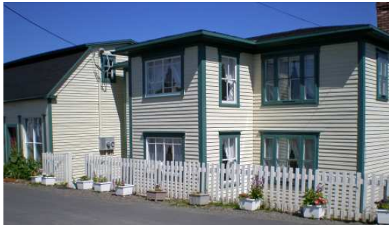
Les quartiers commerciaux