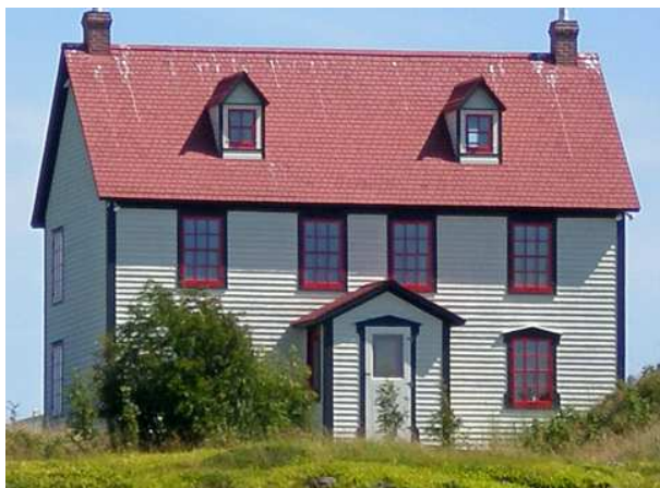
Celle-ci a besoin de peinture