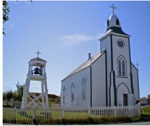
Une autre modeste église en bois