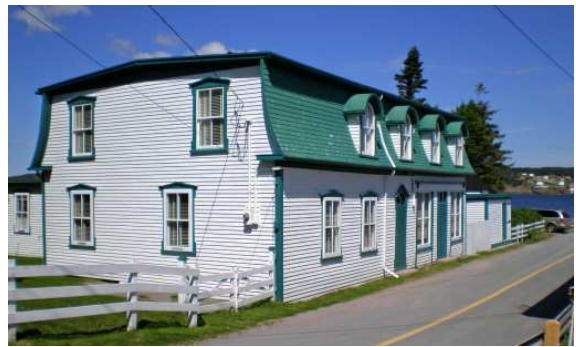
Une vraie maison de village