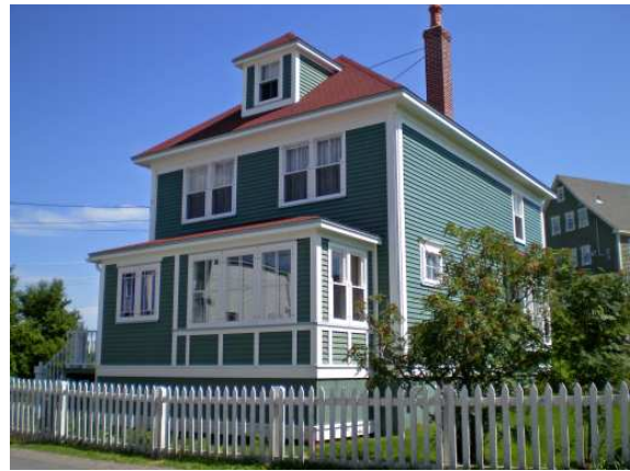
Juste une belle maison