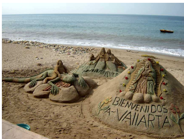
Sculpture dans le sable

Photos du malecón et de la mer prises du balcon d'un resto au 2 e étage