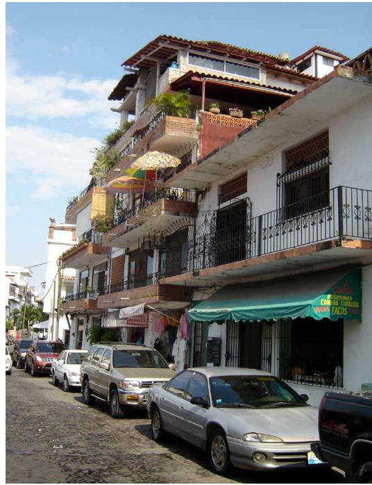
Maisons et commerces typiques