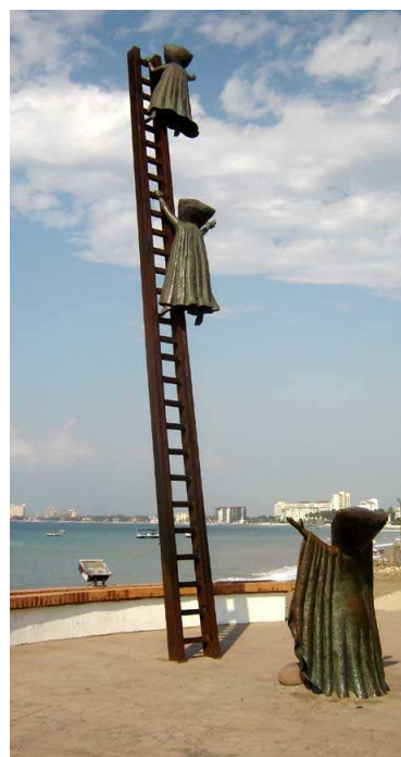
Sculpture de bronze (il y en a plusieurs sur le malecón)