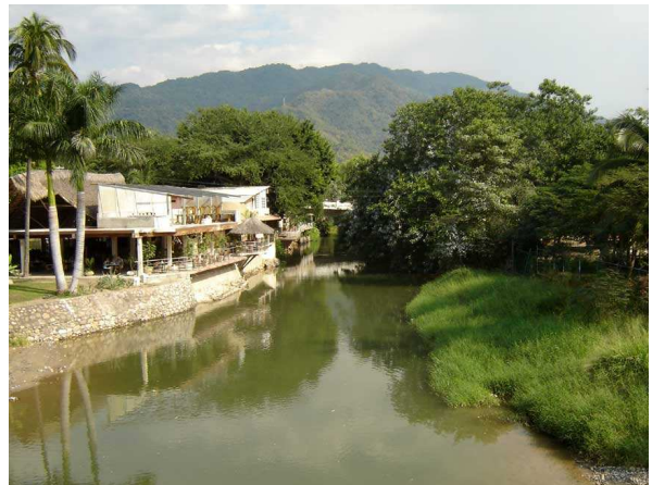
La ville est entourée de montagnes