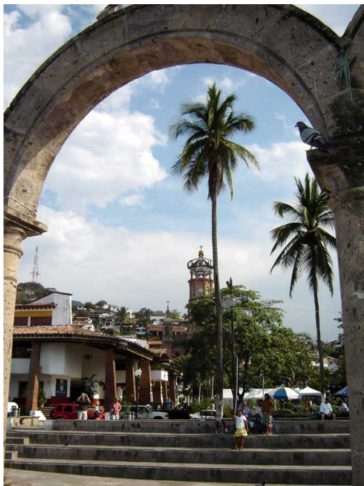
La Cathédrale de la Guadalupe au loin