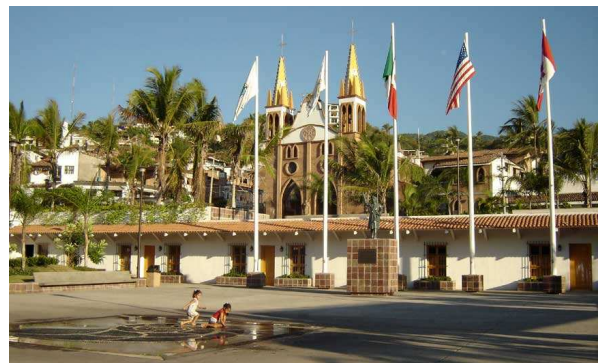
Le zocalo devant cette autre église