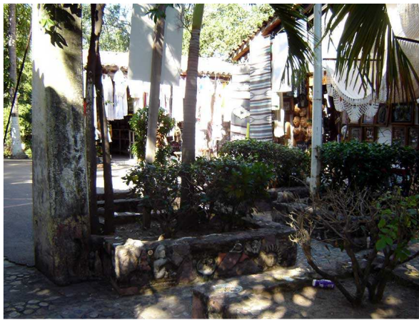
Quelques boutiques sous les arbres

J'ai aussi marché le long de la rivière où a été aménagée, sous les arbres, une promenade bordée de boutiques d'artisanat et de restaurants. C'est un endroit agréable et rafraîchissant pour échapper au soleil omniprésent pendant un certain temps.