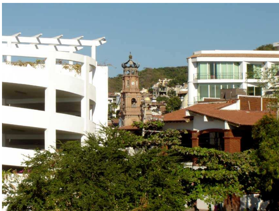
La cathédrale sous un angle différent