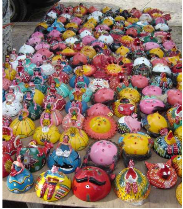
Les couleurs du marché