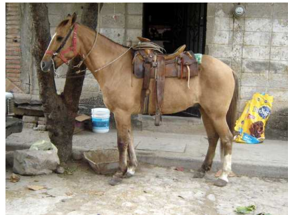
Les couleurs de la ville...