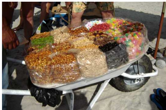
Assortiment de bonbons sur la plage