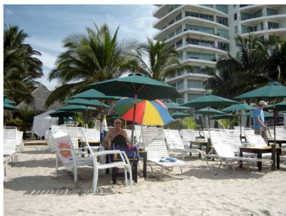
L'aménagement du resto « ETC »

Je dois admettre que les plages de Nuevo Vallarta sont très belles. D'où l'existence de plusieurs hôtels et condominiums et le boom des nouvelles constructions qui se poursuit encore de façon exponentielle.