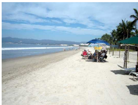
La plage vue de cet endroit