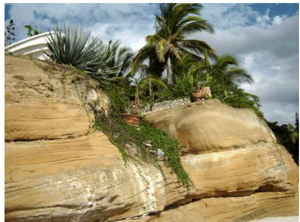
Terrain privé bien aménagé