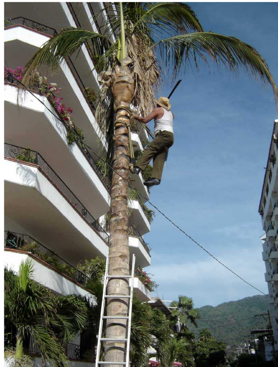
Alors qu'on assiste au nettoyage des Palmiers...