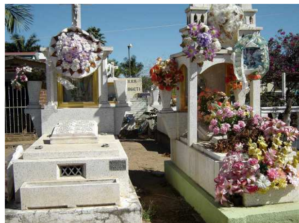
Le cimetière de El Colomo