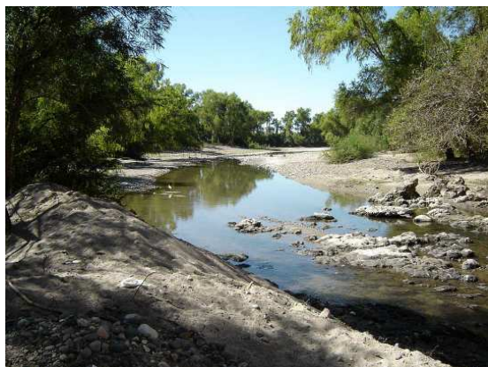
La rivière Ameca