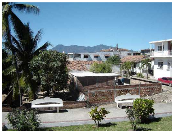
Vue du zocalo