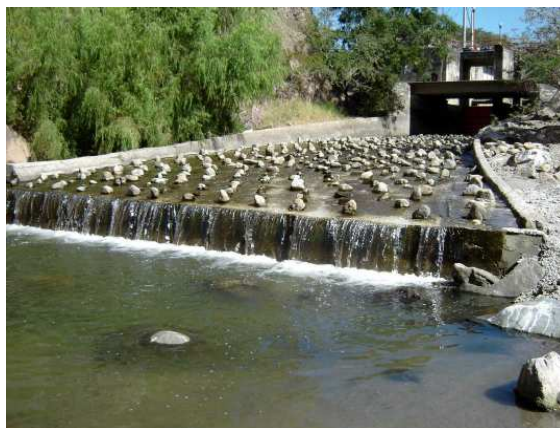
Un des deux barrages de El Colomo