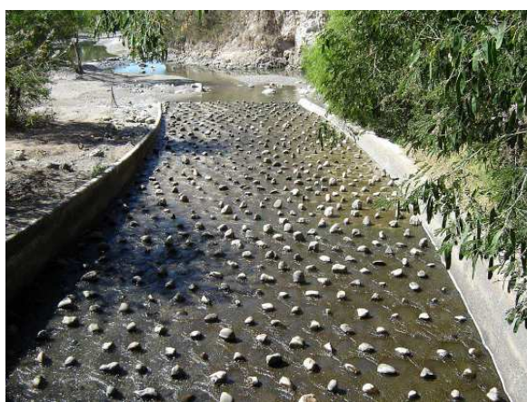
Les roches sont là pour oxygéner l'eau à sa sortie du barrage