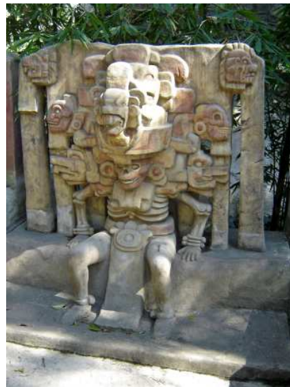
Un des dieux (ou des diables) dont se servaient les grands prêtres pour entretenir la peur ?