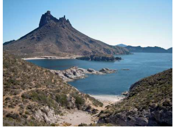
Quelques points de vue en marchant vers le mirador