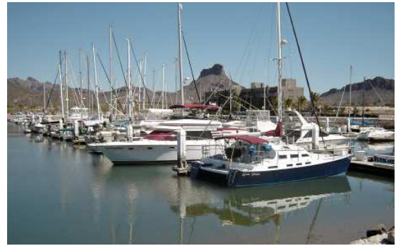
La marina Real, non loin du camping