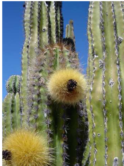
La fleur de ce cactus

http://www.desertusa.com/july96/du_saguaro.html