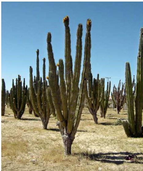
Plantation de cactus saguaro