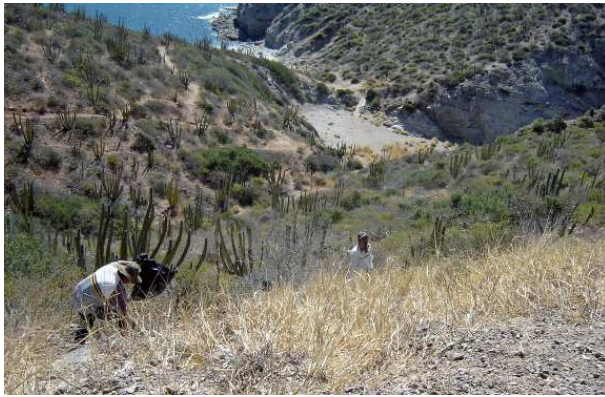
Ces Mexicains ramassent les déchets à flanc de montagne