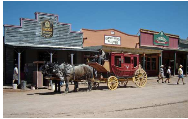
La rue principale de l'ancien Tombstone

Par contre, nous avons bien apprécié notre repas au saloon.