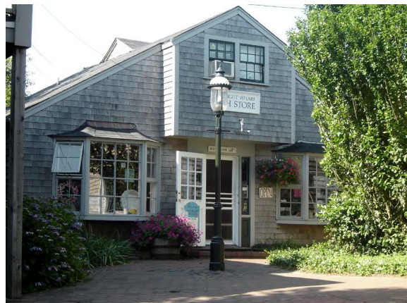
Architecture typique de Nantucket