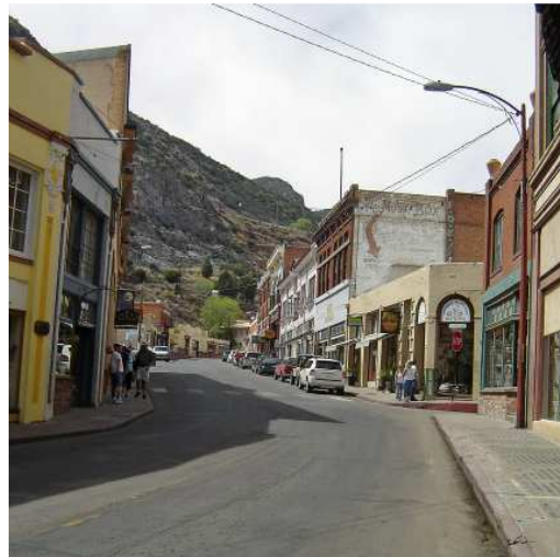
Vue sur la montagne avec le gros « B »