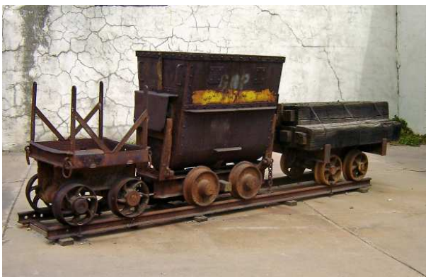
Vestiges d'une autre époque...dont Iron Man qui devrait se nommer Copper Man