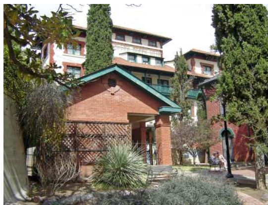
L'hôtel Copper Queen