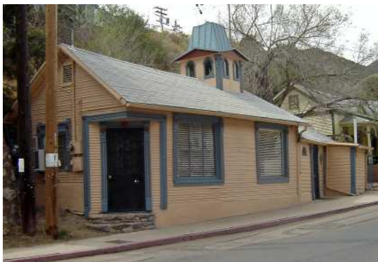
On dirait une petite maison de sorcière (ma maison... ?)