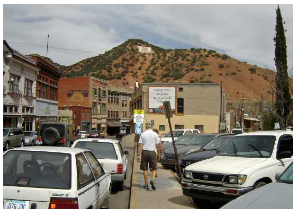
Une autre vue sur la montagne « B »

Nous redescendons ensuite vers l'hôtel Queen qui fut bâtie en 1902 par la compagnie minière et découvrons quelques restaurants que nous n'avions pas vus tantôt.