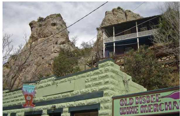
Des gros rochers menaçants