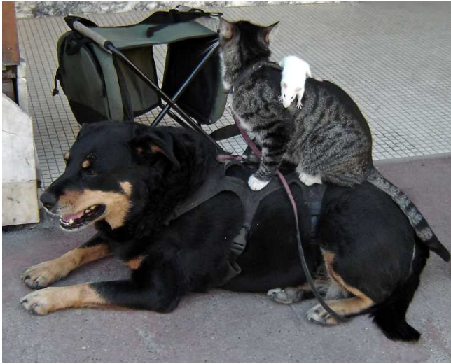
Un chien, son chat et sa souris

Quelques images inusitées pour terminer :