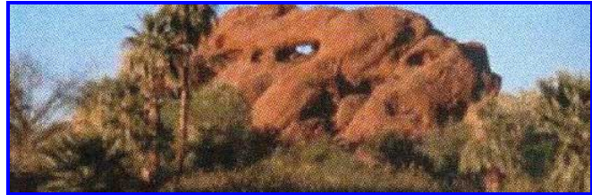
Parc Papago, "Hole-in-the-Rock"

Construit dans les années 1920, le château reflète « l'élégance rustique de l'Arizona » de cette époque. La ville en est maintenant propriétaire et y fait des rénovations. Par la suite, il ne sera ouvert au public que de façon très limitée.