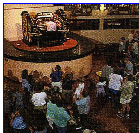
L'orgue Wurlitzer du Organ Stop Pizza

Nous passons une soirée agréable dans une ambiance unique.